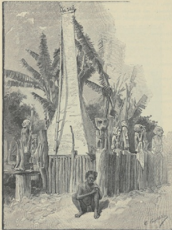
Fig. 51. - Tombeau Bahnar.