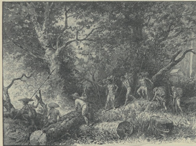
Fig. 52. — Marche dans les « Raïs » ou défrichements. D'après un dessin de l'auteur.

pris ses ordres et m'ont laissé un jour sans porteurs. Pareil accident ne