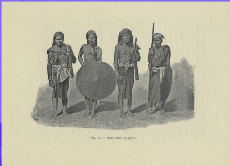
Fig. 31. — Djairai armés en guerre.